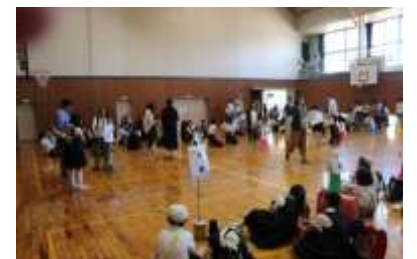
昨年度の引き渡し訓練の様子